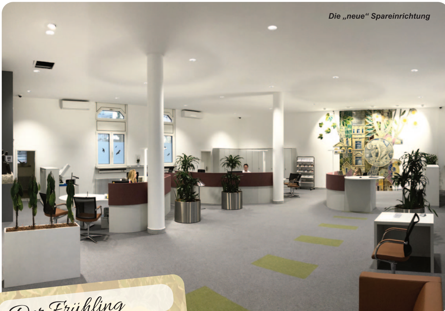
Die „neue“ Spareinrichtung