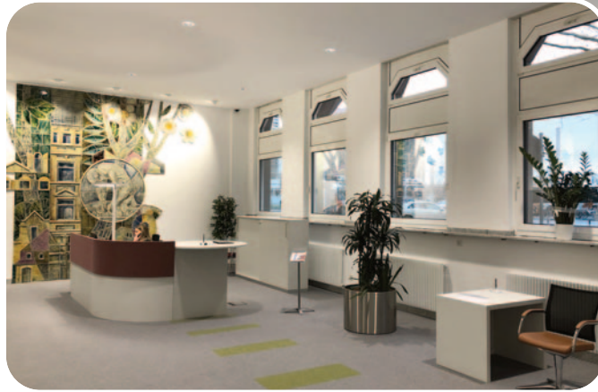
Umsetzung der Modernisierung

Darüber hinaus mussten noch weitere Herausforderungen im Rahmen dieser Modernisierungsmaßnahme bewältigt werden. Rein organisatorisch musste die Spareinrichtung inklusive unserer Sparmit-