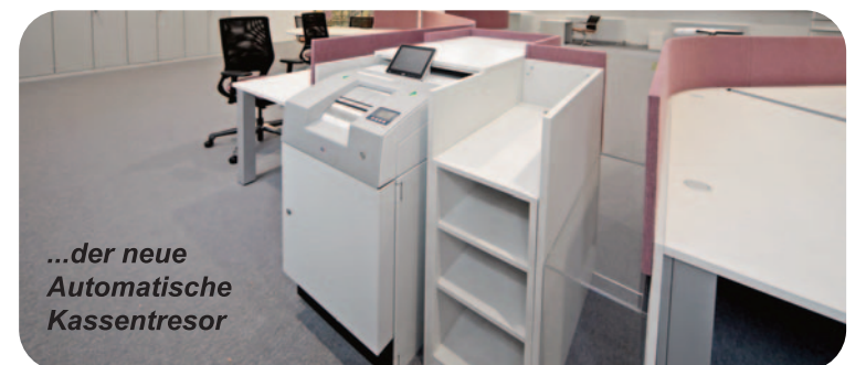
...der neue Automatische Kassentresor