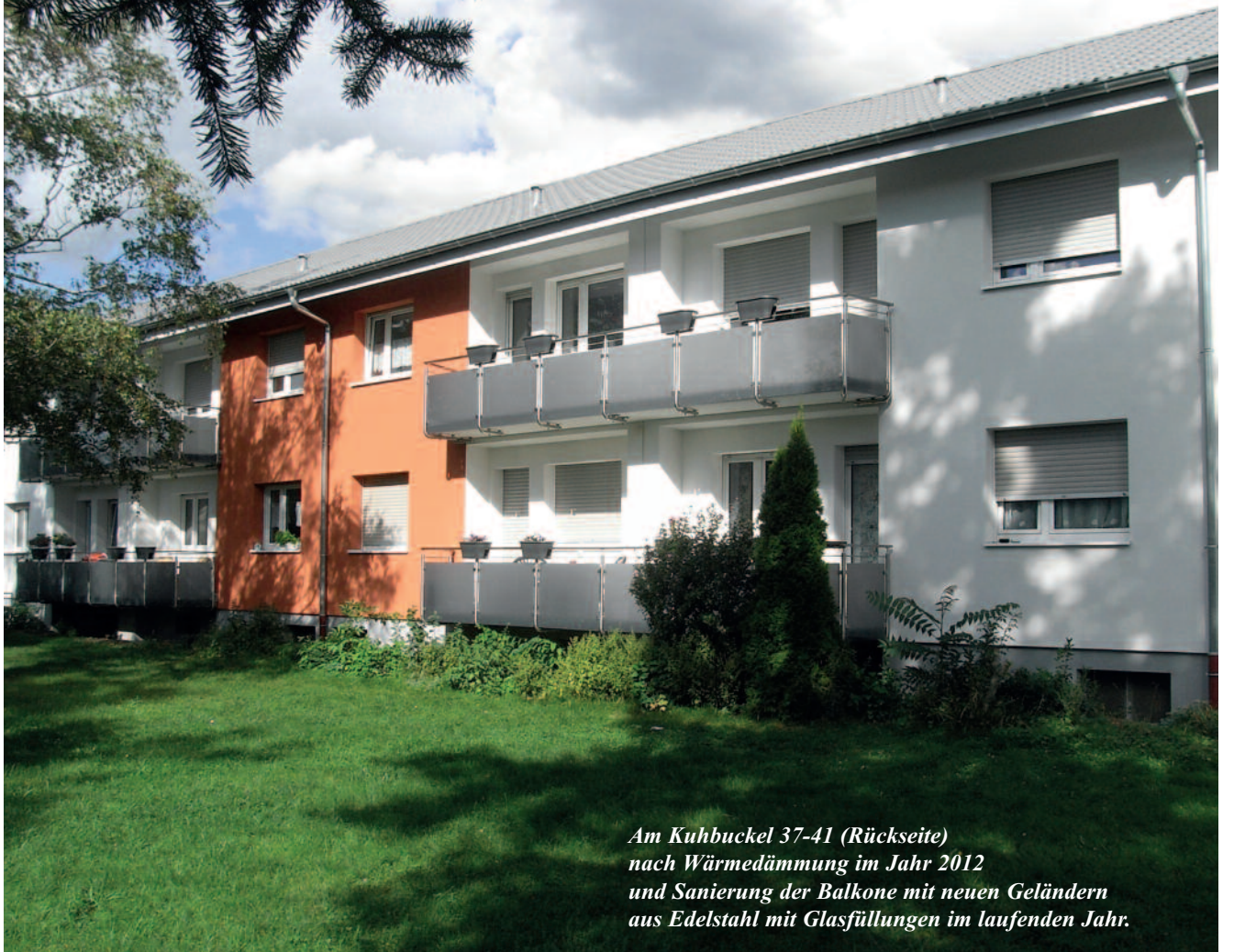
Am Kuhbuckel 37-41 (Rückseite) nach Wärmedämmung im Jahr 2012 und Sanierung der Balkone mit neuen Geländern aus Edelstahl mit Glasfüllungen im laufenden Jahr.