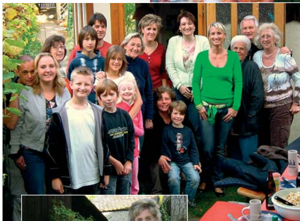
In guter Gesellschaft hat man gut Lachen

Bereichernd, wenn sich Junge und jung Gebliebene austauschen!